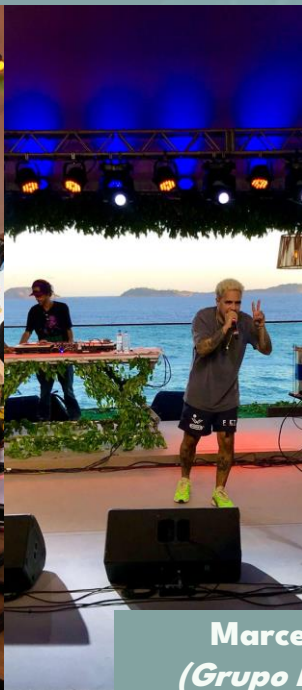
Marcelo D2 (Grupo ENEVA)