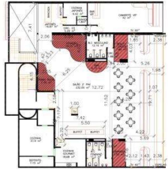
▲ 2º PAVIMENTO